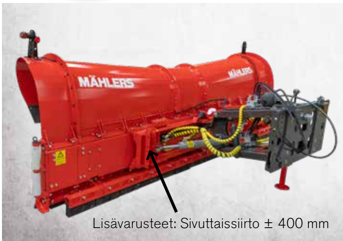
Lisävarusteet: Sivuttaissiirto \pm 400 mm