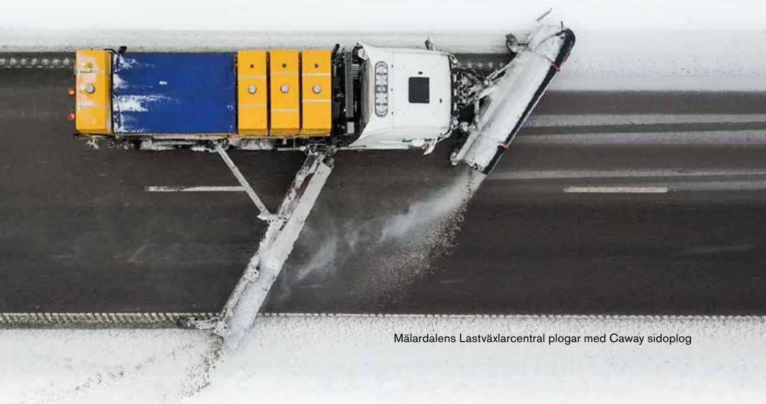
Mälardalens Lastväxlarcentral plogar med Caway sidoplog